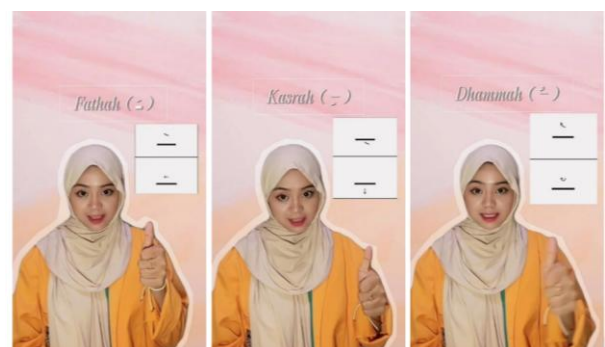
Gambar 1. Tampilan Video Pembelajaran

Tampilan video pembelajaran pengenalan tanda baca huruf hijaiyah pada gambar 1 di bawah ini :