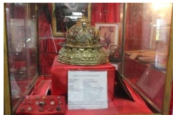
Gambar 4. Saloka

keasliannya. Penataan garis dan nama-nama raja dalam silsilah ini memberikan gambaran tentang hubungan kekeluargaan, pergantian kepemimpinan, dan kontinuitas pemerintahan dalam Kerajaan Gowa. Informasi ini sangat penting dalam memahami sejarah kerajaan, termasuk struktur kekuasaan, politik, dan peran masing-masing raja dalam perkembangan budaya dan tradisi Gowa. pajangan silsilah ini berfungsi sebagai alat edukasi bagi pengunjung, terutama generasi muda, untuk mengenal lebih dalam tentang warisan sejarah Gowa. Dengan tampilan yang jelas dan rinci, silsilah ini membantu masyarakat memahami konteks sejarah dan kedudukan Kerajaan Gowa dalam perjalanan sejarah Sulawesi Selatan.