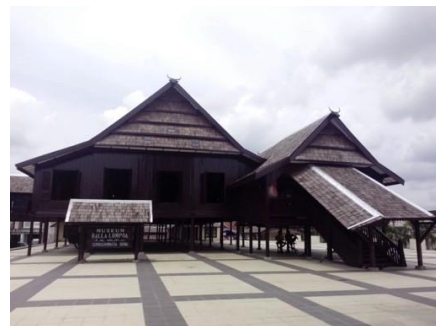
Gambar 1. Museum Balla Lompoa

Balla Lompoa secara harfiah berarti rumah besar atau rumah kebesaran yang dihuni oleh raja. Balla Lompoa berada di tengah Kota Sungguminasa Kabupaten Gowa, Provinsi Sulawesi Selatan, tepatnya di Jalan Sultan Hasanuddin No 48. Lokasi itu merupakan situs budaya dalam sebuah kompleks yang luasnya sekitar tiga hektar. Di bagian belakangnya terdapat tembok batu alam yang tebal dan pintu kayu yang lebar dan kokoh, sedangkan di bagian depannya berpagar permanen yang rendah dan halaman yang terbuka. Di samping bangunan Balla Lompoa terdapat bangunan Istana Tamalate yang ukurannya jauh lebih besar yang dibangun pada era kepemimpinan Bupati Gowa Syahrul Yasin Limpo, tahun 1980-an