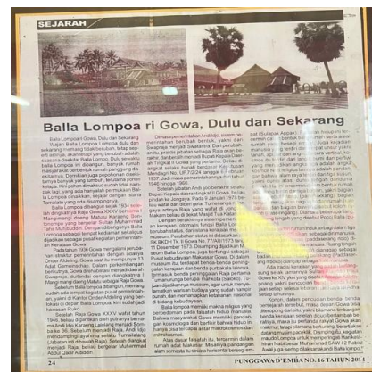
Gambar 2. Sejarah Museum Balla Lompoa Gambar di atas adalah kliping koran atau

tersimpan peninggalan benda-benda pusaka Kerajaan Gowa. Benda-benda kerajaan ini masih tetap utuh dan terawat dengan baik dalam museum Balla Lompoa. Selain berfungsi sebagai museum, Balla Lompoa juga berfungsi sebagai tempat pelaksanaan upacara-upacara adat. Salah satu upacara adat yang menjadi agenda tahunan pemerintah Kabupaten Gowa adalah accera kalompoang, yaitu pencucian benda-benda pusaka Kerajaan Gowa yang dilaksanakan setiap bulan Zulhaji atau pada lebaran Idul Adha. Upacara ini berlangsung sejak masa pemerintahan Raja Gowa XIV Sultan Alauddin. Menurut kepercayaan orang-orang Makassar dahulu, bilamana benda-benda kerajaan telah dicuci dan timbangannya berkurang berarti akan ada malapetaka yang akan menimpa negerinya atau tidak mendatangkan keberhasilan, sebaliknya apabila benda pusaka itu dicuci timbangannya lebih berat dari semula pertanda akan dapat mendatangkan kemakmuran bagi masyarakat. (wawancara Tenribali, 15 April 2010). Beberapa koleksi museum Balla Lompoa sebagai berikut.